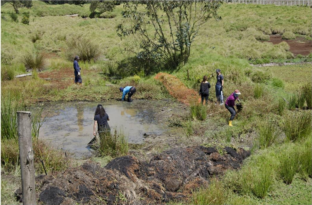
Chía's citizens taking care of wetland Humedal de los Andes.