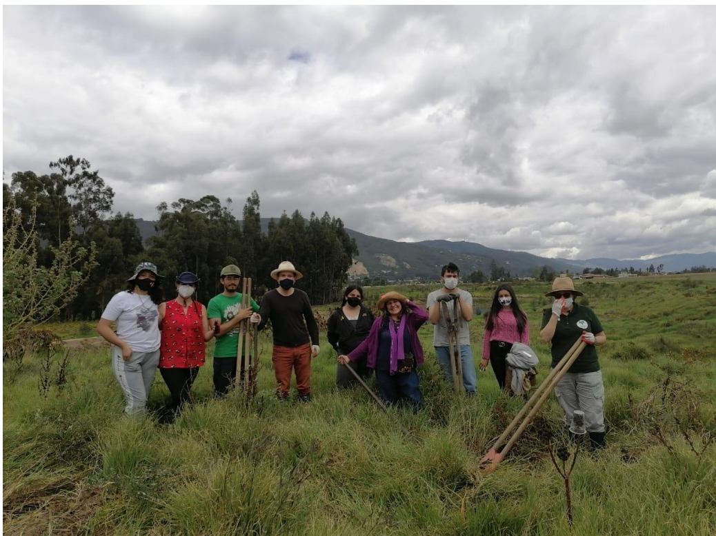
Some members of Rediacción after planting 200 trees in the struggle for the restoration of Bogota River.

In the short-medium term, Rediacción plans to have its actions in projects and documents such as the Organic Law of the Bogotá-Cundinamarca Metropolitan Region; the Formulation of Municipal Land Use Plans; the creation and consolidation of a green belt to contain the Bogotá-Sabana conurbation; future actions for the ecological restoration of the Bogotá River ring road; and the constitution of a Natural Reserve for civil society in the Los Andes wetland.