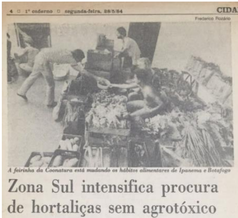
Clipping of an unidentified newspaper article about Coonatura's organic sales in the South Zone of Rio de Janeiro.