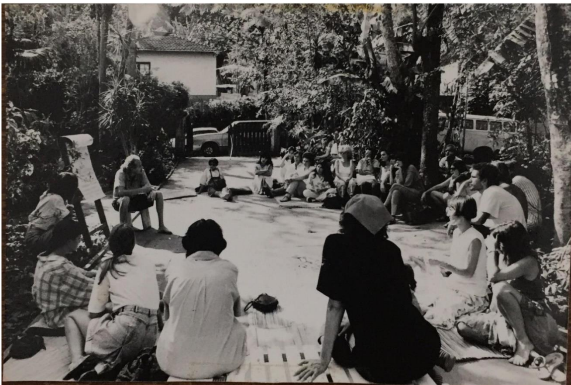
Coonatura meeting.